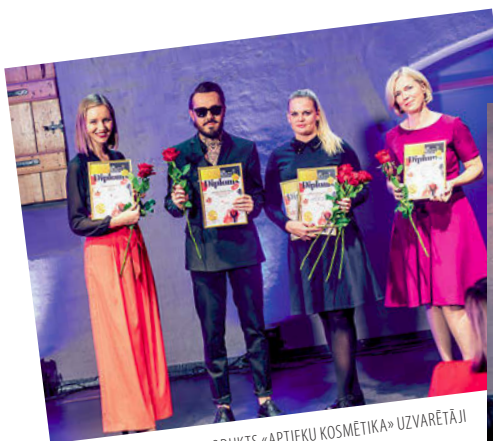
NOMINĀCIJAS LABĀKAIS PRODUKTS «APTIĒKU KOSMĒTIKA» UZVARĒTĀJI