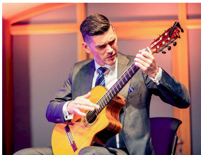
VIRTUOZAIS ĢITĀRISTS KASPARS ZEMĪTIS