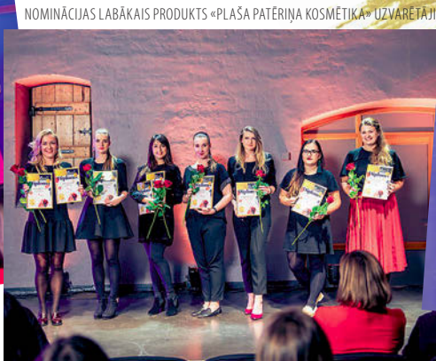
NOMINĀCIJAS LABĀKAIS PRODUKTS «PLAŠĀ PATĒRIŅA KOSMĒTIKA» UZVARĒTĀJI