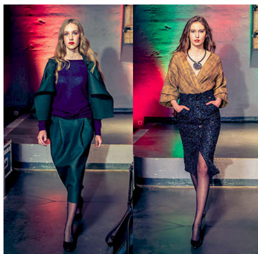
TĒRPI NO «KLAŠE» KOLEKCIJAS

LILIT VIENMĒR BIJIS SVARĪGI, LAI TEV, MŪSU LASĪTĀJAI, IR VISPĀRLIECINOŠĀKĀ INFORMĀCIJA PAR TO, KO, KĀ UN KĀPĒC LIETOT SAVA SKAISTUMA UZTURĒŠANAI, KOPŠANĀI UN AKCENTĒŠANAI. TIEŠI TĀDĒĻ, 18. OKTOBRĪ AR GRANDIOZU CEREMONIJU NOSLĒDZĀS GADA GAIDĪTĀKAIS NOTIKUMS SKAISTUMKOPŠANAS INDUSTRIJĀ – LILIT BEAUTY AWARDS 2018 , NOSAKOT GADA LABĀKOS UN KVALITĀTĪVĀKOS PRODUKTUS SKAISTUMKOPŠANAS JOMĀ.